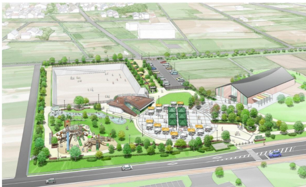
2022年4月「深谷テラスパーク」をプレオープン（イメージ）

深谷市は、花園インターチェンジ（以下、「花園 IC」）の近接地に観光拠点を新設し、市外・県外からの来訪者誘致を行い、農業と観光の振興に寄与する「花園 IC 拠点整備プロジェクト」の一環として、同事業地の公共ゾーンに「深谷テラスパーク」を本年4月15日（金）にプレオープンいたします。