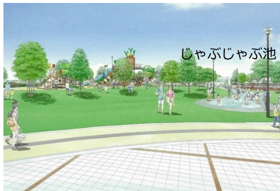
芝生広場やじゃぶじゃぶ池（イメージ）