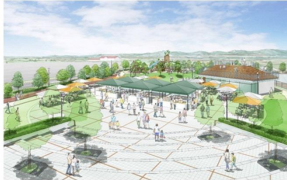
円形広場（イメージ）