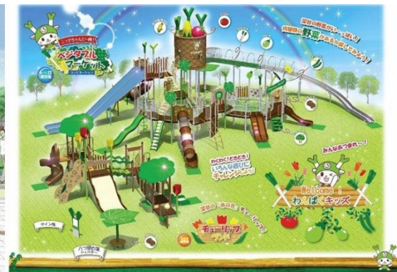
大型遊具（イメージ）