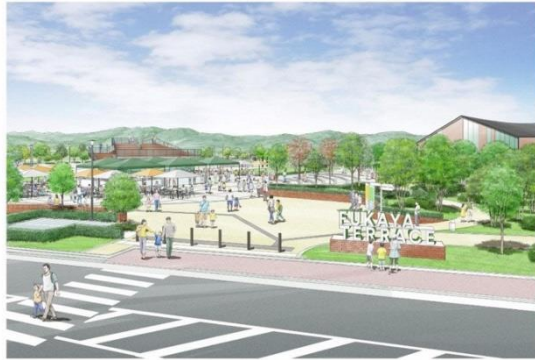
東側エントランス（イメージ）

「深谷テラスパーク」は、円形広場や野菜や花をモチーフにした大型遊具、じゃぶじゃぶ池などを配置した約 15,000m 2 の公園緑地（調整池約 4,200m 2 を含む。）で、気軽に「深谷の魅力」に触れることができる場を目指します。