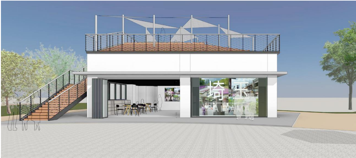
管理棟 デジタルサイネージ（イメージ）